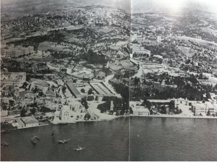
Şehri terkeden işgal kuvvetlerine ait uçaktan 6 Haziran 1923'te çekilen fotoğraf.

edilmesini ister. Dönemin gözde mimarlarından hassa mimarı Garabet Balyan'a da sarayı inşa etmesi için görev verir.