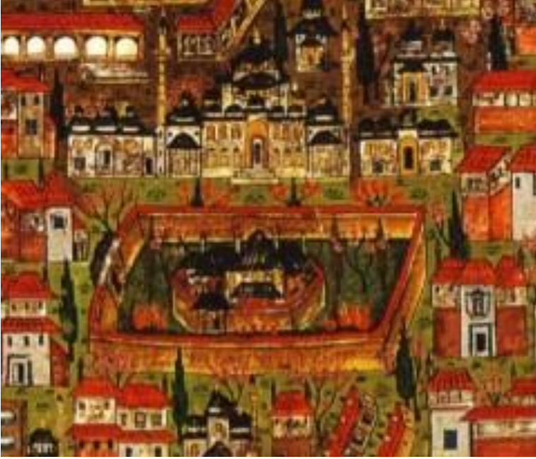
Saray-ı Atik-i Amire'nin Matrakçı Nasuh tarafından çizelen minatürü.

1472 senesinde Fatih, bugün Çinili Köşk olarak bildiğimiz ve İstanbul Arkeoloji Müzeleri tarafından kullanılan köşkü ya da sarayı yaptırıyor. Burası yazlık saray olarak kullanılmaya başlanıyor. Ancak belli ki bu yeni köşkün bulunduğu yer Fatih'i oldukça etkiliyor ki eş zamanlı olarak yeni sarayın yani Saray-ı Cedid-i Amire'nin inşaatına başlanıyor. Sonraki yıllarda Topkapı Sarayı olarak anılmaya başlanacak bu sarayın inşaatı 1478 senesinde bitiyor. Ancak Topkapı da elbet yapıldığı dönemdeki haliyle kalmıyor. Değişen ev sahiplerinin eklettiği yapılarla organik bir yapıya bürünüyor ve gün geçtikçe büyüyor.