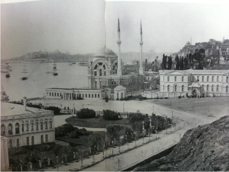
İstanbul'un en eski fotoğraflarından birisi (1855).

Sarayın ayrı işlevlerdeki üç bölümünün (Selamlık, harem ve muayede salonu) tek çatı altında olması onu Türk saray mimarisinden ayıran özelliklerinin başında gelmektedir. Bu tek çatı altında toplanan ana yapı toplam 14595 metrekareye yayılan 285 oda, 43 salon, 6 balkon ve 6 hamamdan oluşur. Bu mekanlar 1427 pencere ve 25 değişik kapı ile kara ve deniz yönüne açılır.